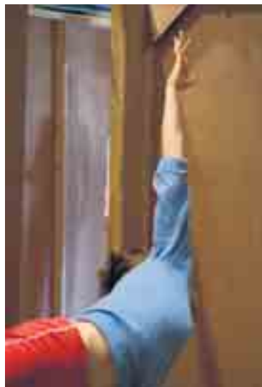
Beeld uit 'Apenverdriet' van Cie Cecilia.

De beelden zeggen vaak meer over de mensen op de scène dan over het verhaal van de voorstelling. Wie langs de suggestieve fragmenten loopt, krijgt de indruk dat de blik op een kier staat: de foto's geven je slechts beperkte houvast, ze laten je veeleer voelen wat verstilling is en hoe daar po-