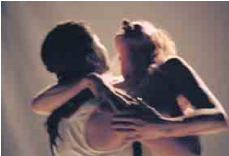
Beeld uit 'Broeders van liefde' van Cie Cecilia.

Met de fototentoonstelling 'jardin/cour' legt Kurt Van der Elst de suggestiviteit van theater bloot. En met zijn eerste portretten meteen ook de intimiteit.