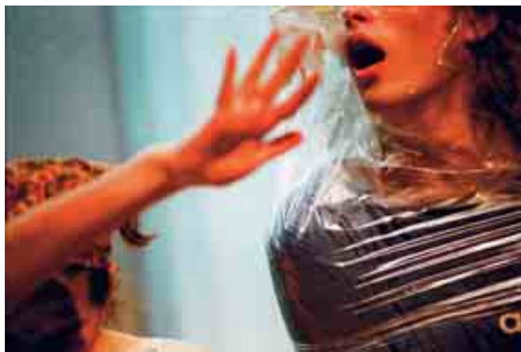
Beeld uit 'Allemaal Indiaan': de fotograaf snijdt soms dwars door lichamen.

'Ik speel graag met beweging', zegt Van der Elst. 'Door te va-