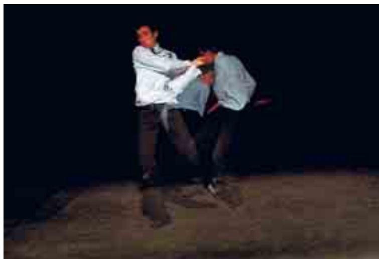
Dit beeld uit 'Altijd prijs' heeft alleen de camera kunnen waarnemen; het publiek heeft het nooit gezien.